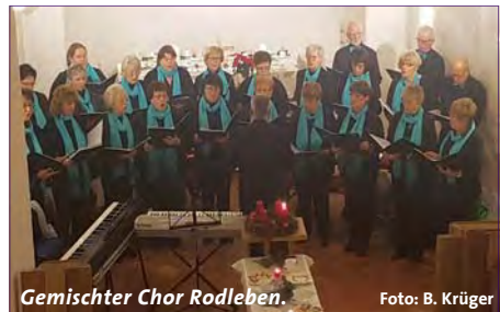
Gemischter Chor Rodleben.