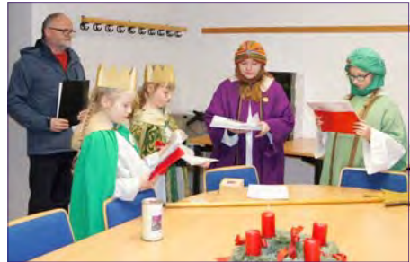
Sternsinger im Ev. Regionalpfarramt.