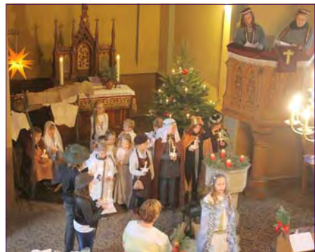
Erstes Krippenspiel nach 36 Jahren in der Rietzmecker Kirche.