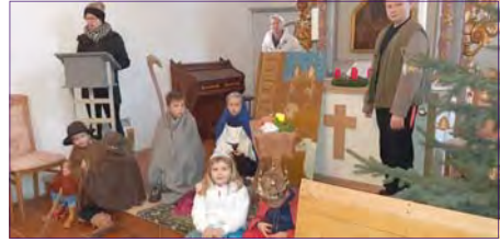
Krippenspiel in Thießßen.