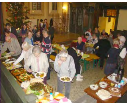
Nach dem Gottesdienst