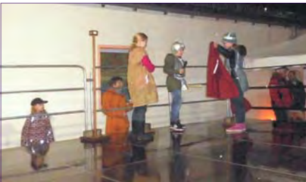
Martinsspiel der Hortkinder (Bild oben). Bild unten: „Glückskäfer Dance Kids“.