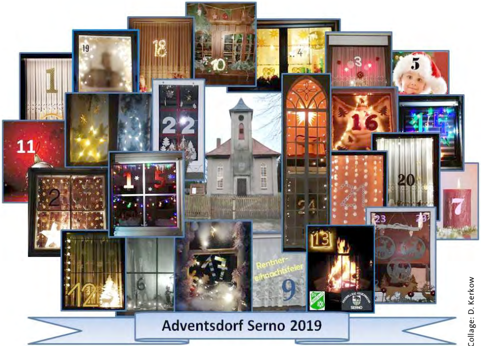
Collage: D. Kerkow