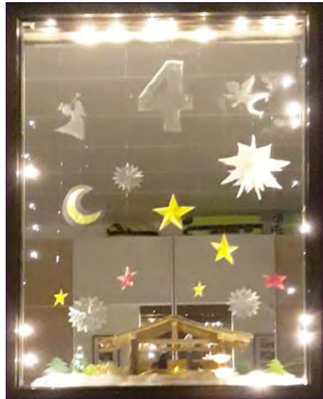
„Auf dem Weg zur Krippe“ in Thießen.

Nach einer kleinen Andacht mit Gebet, Geschichte, Liedern und Segen lud die gastgebende Familie zu einem Adventstee, Glühwein, Kek-