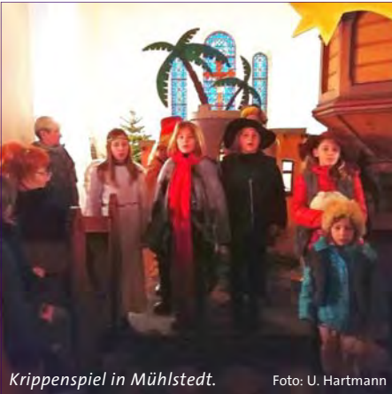
Krippenspiel in Mühlstedt.