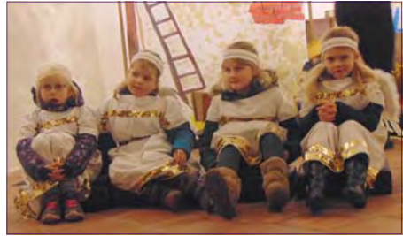
Krippenspiel des Kindergartens.

Der Adventsmarkt im Kindergarten ist jedes Jahr ein ganz besonderes Event. Nach der feierlichen Eröffnung in der Kirche, lud Haus und Hof vom Kindergarten zum Schlendern ein. Hinter jeder Tür ein anderes Angebot. Gleich am Anfang konnte man sich schnell mit einem Kinderpunsch oder Glühwein aufwärmen, auch zwischen leckeren Waffeln, Schokoladenäpfeln, Tee, Kaffee oder Grillwürstchen entscheiden. Die Bastelstube war wieder erfüllt von kreativem Werkeln. So entstanden z.B. Engel aus Baumrinde, Kerzenhal-