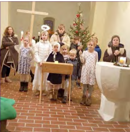
Krippenspiel in Ragösen.